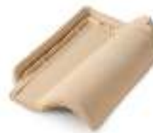
RPR007 MAGNA GRECIA