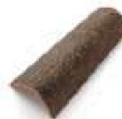
C1CS1 CHAMPAGNE SCURO