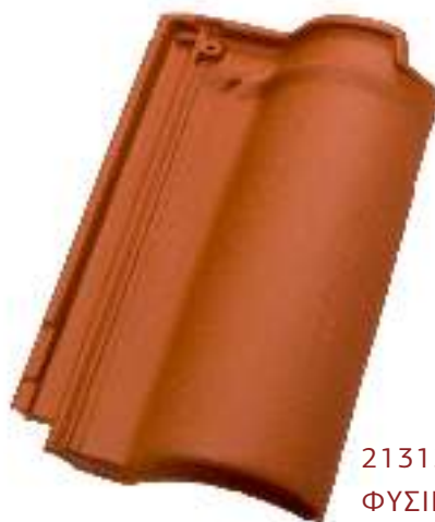
213131004 ΦΥΣΙΚΟ ΚΟΚΚΙΝΟ