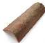
C1CC1 CHAMPAGNE CHIARO