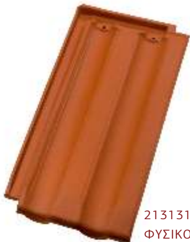
213131005 ΦΥΣΙΚΟ ΚΟΚΚΙΝΟ