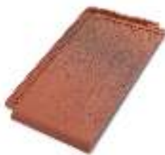
TIJK JASPEE RED