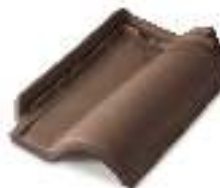
RPR006 TESTA DI MORO